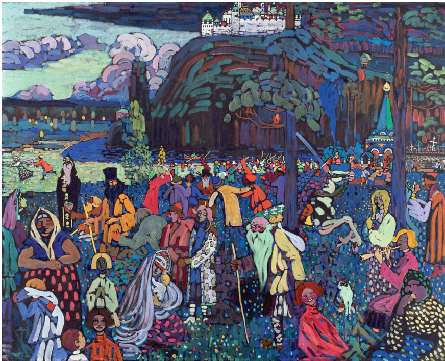
Vasilij Kandinskij, Vita variopinta (1907) Monaco di Baviera, Städtische Galerie im Lenbachhaus

Proponiamo alcuni testi della Chiesa, video, articoli, interviste, utili alla riflessione personale o di gruppo