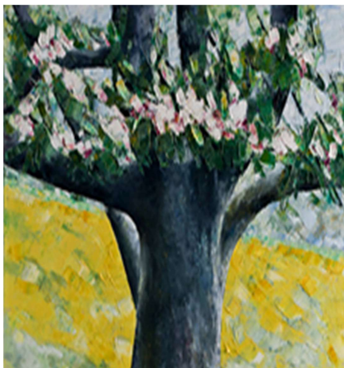
Paolo Vallorz, Melo canada in fiore di primavera alle Robbiane (particolare), Rovereto, Mart (in esposizione temporanea)

Proponiamo alcuni passi biblici, video, articoli, interviste, utili alla riflessione personale o di gruppo