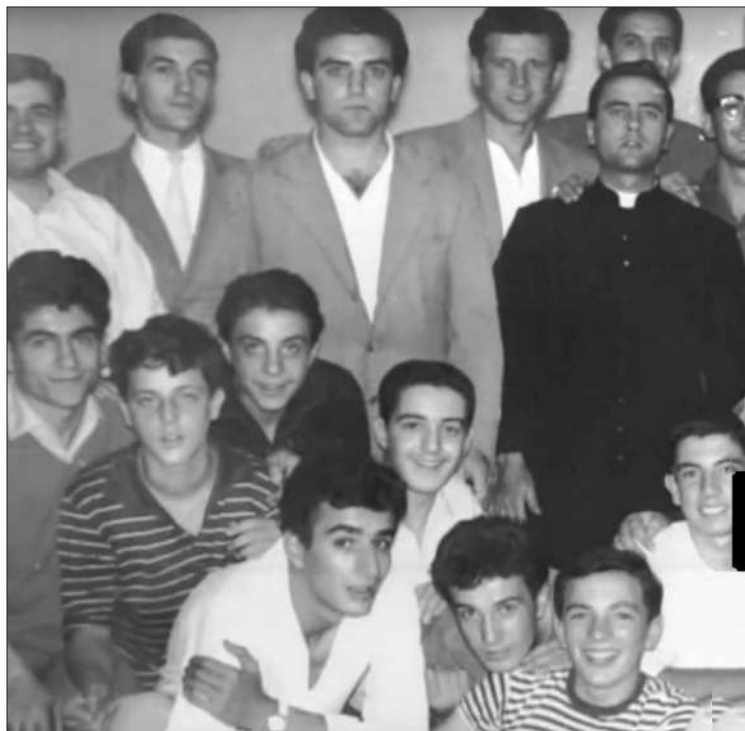
Da Fondo Giac, busta 27, fascicolo 7 presso Archivio storico dell'Azione Cattolica Italiana, Presidenza diocesana di Roma, via della Pigna 13 A, Roma.

Questa formazione non deve essere vista come puramente teorica, ma come una formazione attraverso l'azione. «Perciò i laici imparino a tutto vedere, giudicare e agire nella luce della fede, a formarsi e perfezionarsi mediante l'azione».